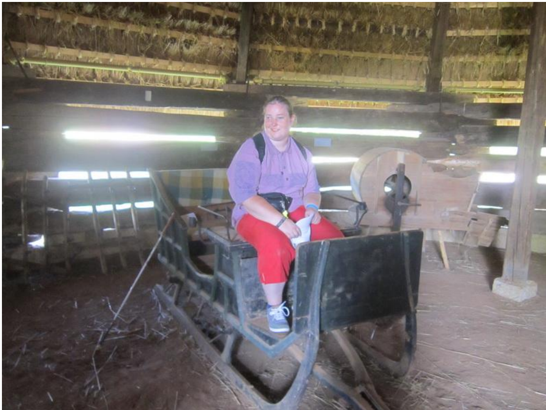
Na starých saních (skanzen Kuřim)