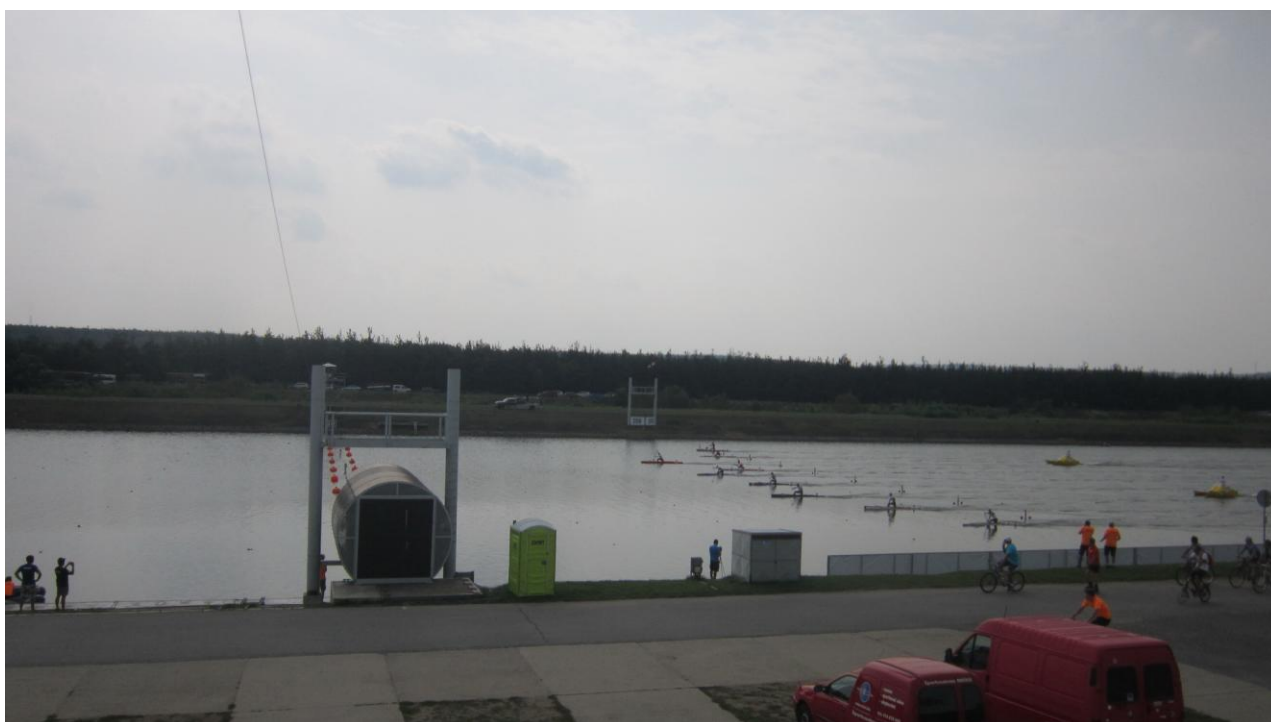
Mistrovství světa v kanoistice v Račicích