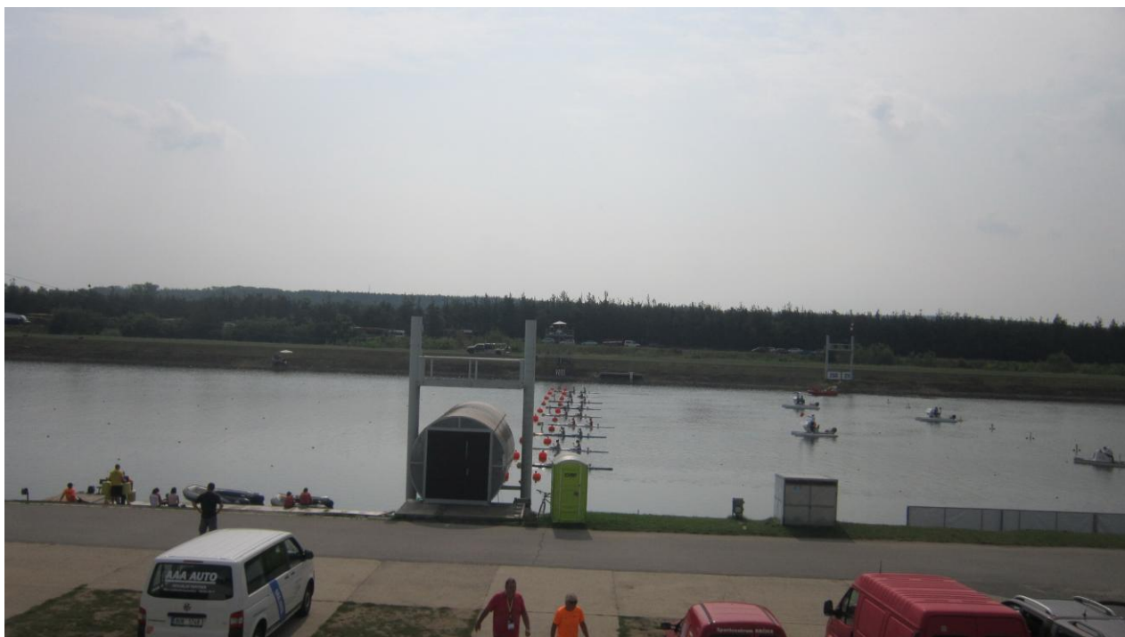
Mistrovství světa v kanoistice v Račicích