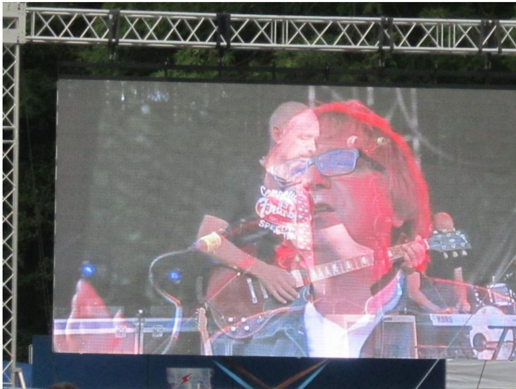
Miro Žbirka s kapelou